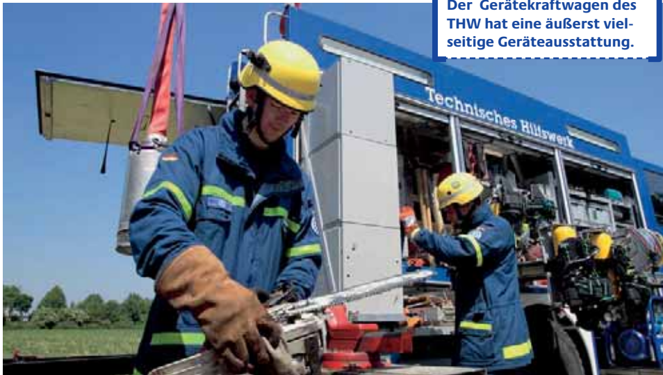
Der Gerätekraftwagen des THW hat eine äußerst vielseitige Geräteausstattung.