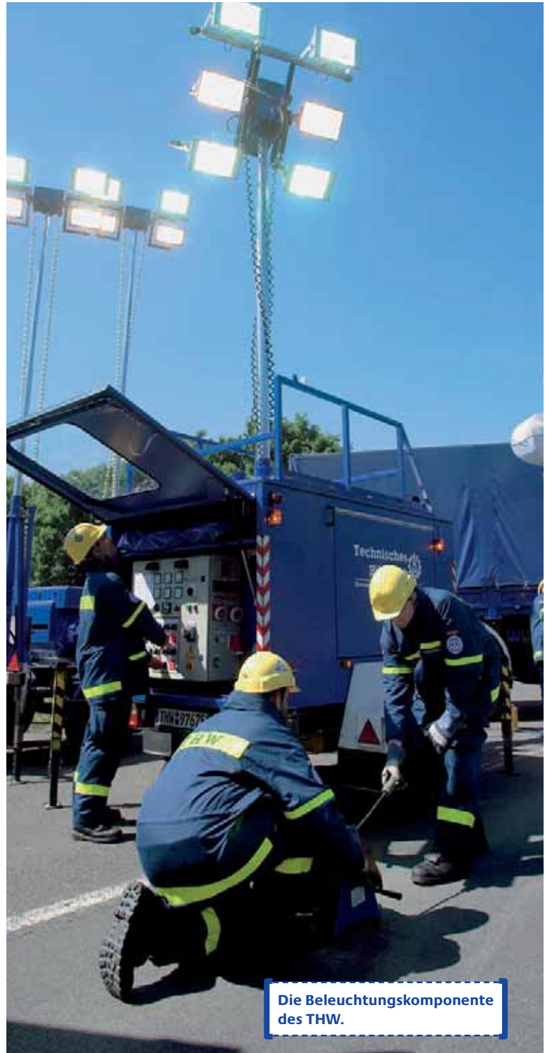
Die Beleuchtungskomponente des THW.